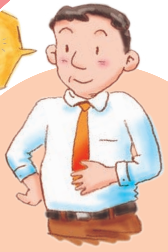
ピロリ菌がいるかどうかの検査法 (除菌の成功を確認する際にも用いられる)